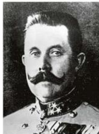
Rychlejší než TBC byla v případě arcivévodě Ferdinanda kulka.