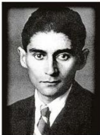
Franz Kafka se vypisoval ze své choroby v dopisech.