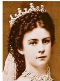
Cisařovna Sissi také trpěla plicní chorobou.

Tuberkulóza. Básníci skládali na její oltář verše a životy. Už zase pokořila covid a je infekci No. 1.