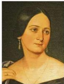
Božena Němcová trpěla ke konci života tuberkulózou.